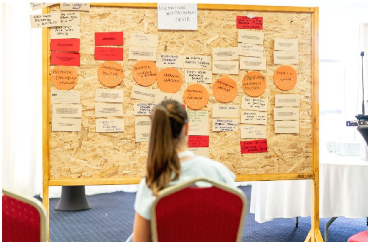
Sa sastanka Radne grupe za izradu Strategije za mlade, septembar 2022. godine

Ministarstvo sporta i mladih nadležno je za planiranje, implementaciju i razvoj omladinske politike. Zakon o mladima (2019) definiše cilj koji se odnosi na unapređenje društvenog položaja mladih i stvaranja uslova za njihovo aktivno učešće. Zakon trenutno teži da ostvari ovaj cilj jedino kroz mjeru kreiranja i implementacije omladinske politike. Zakonodavni okvir, kao i praksa pojedinačnih resorsa i međuresornog djelovanja unutar Vlade, nijesu sinhronizovani i ne podstiču nesmetanu implementaciju omladinske politike (počevši od činjenice da su mladi definisani i označeni kao različita starosna kategorija u različitim resorima). Time je otežano praćenje realizacije strateških dokumenata iz oblasti koje se odnose na mlade, kao i analiza