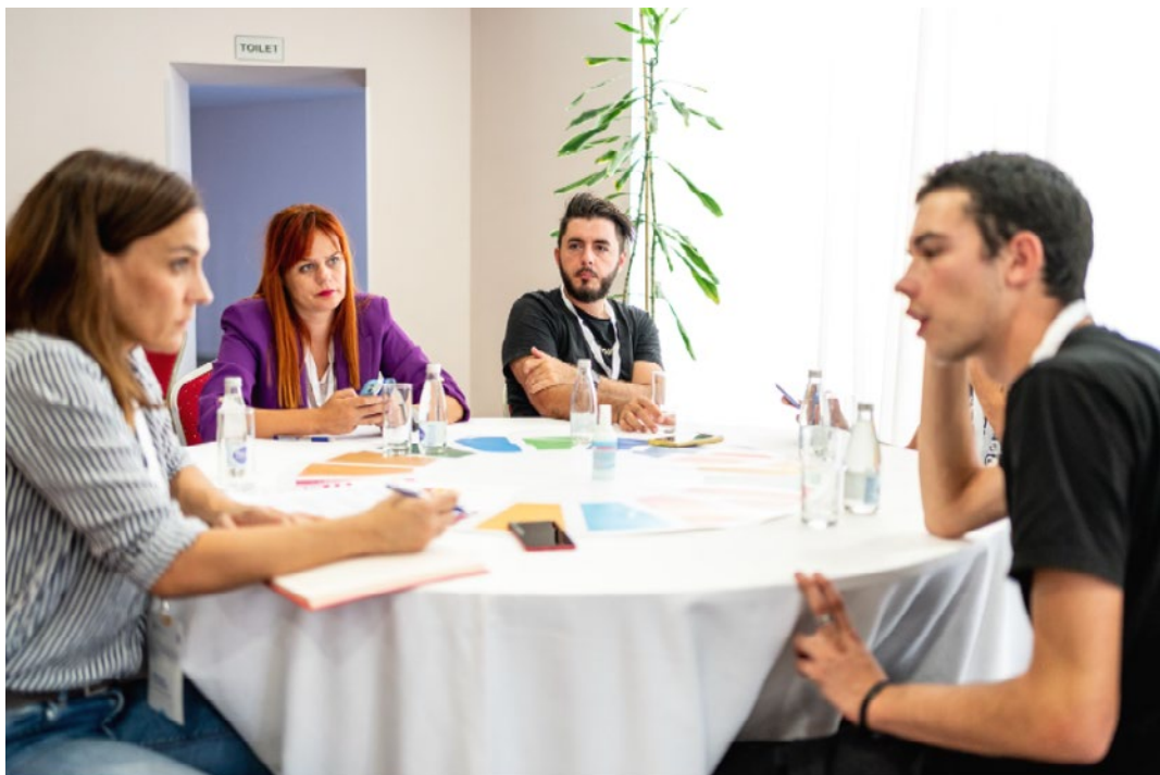
Sa radionice Radne grupe za izradu Strategije za mlade – sesija posvećena razgovoru Radne grupe s mladima, septembar 2022. godine

da im se političari ne obraćaju. 79 U jednoj od studija o mladima u Crnoj Gori, dio sagovornica sa fokus grupa naglašava da su primijetile određene promjene u društvu, te da se sve više mladih ljudi, uključujući i mlade žene, aktivira. Sagovornice napominju da žene često djeluju iz „sjenke“ kako kažu, odnosno da se ne eksponiraju toliko javno, ali da doprinose određenim promjenama, posebno kroz NVO sektor. Dalje, navode da je mladim ženama potrebno dati više prostora u partijama, da im se omogući da se više eksponiraju i da osjete da se njihov glas čuje, te da su i one same dio procesa. Takođe, objašnjavaju i da bi to potencijalno motivisalo druge mlade žene da se aktiviraju vođene primjerom uspješnih žena na javnoj sceni. 80 Očekivano, žene su češće među onima koji vjeruju da bi fokus trebalo da bude poboljšanje položaja žena u društvu. 81